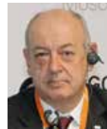
Луис Бертран Рафекас Генеральный секретарь, Международный газовый союз / IGU