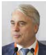
П. Завальный , Председатель Комитета по энергетике, Государственная Дума ФС РФ